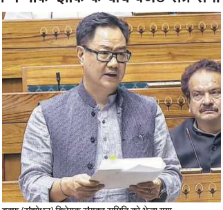
वक्फ (संशोधन) विधेयक संयुक्त समिति को भेजा

रीजीजू और संसद की संयुक्त समिति संसद के शीतकालीन सत्र के अंतिम दिन वक्फ संशोधन विधेयक पर रिपोर्ट सौंप देंगे। लोक सभा और राज्य सभा ने अपने उन 21 और 10 सदस्यों के नामों की भी घोषणाएं कीं, जो संयक्त समिति में